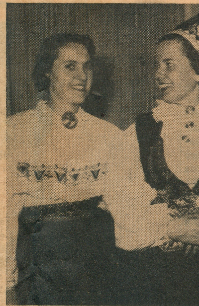
Kaks saarlannat, peotoimkonna liiget töötavad õllekapa Saaremaa tervisele on ehtsad. Parem all õhtul esinenu