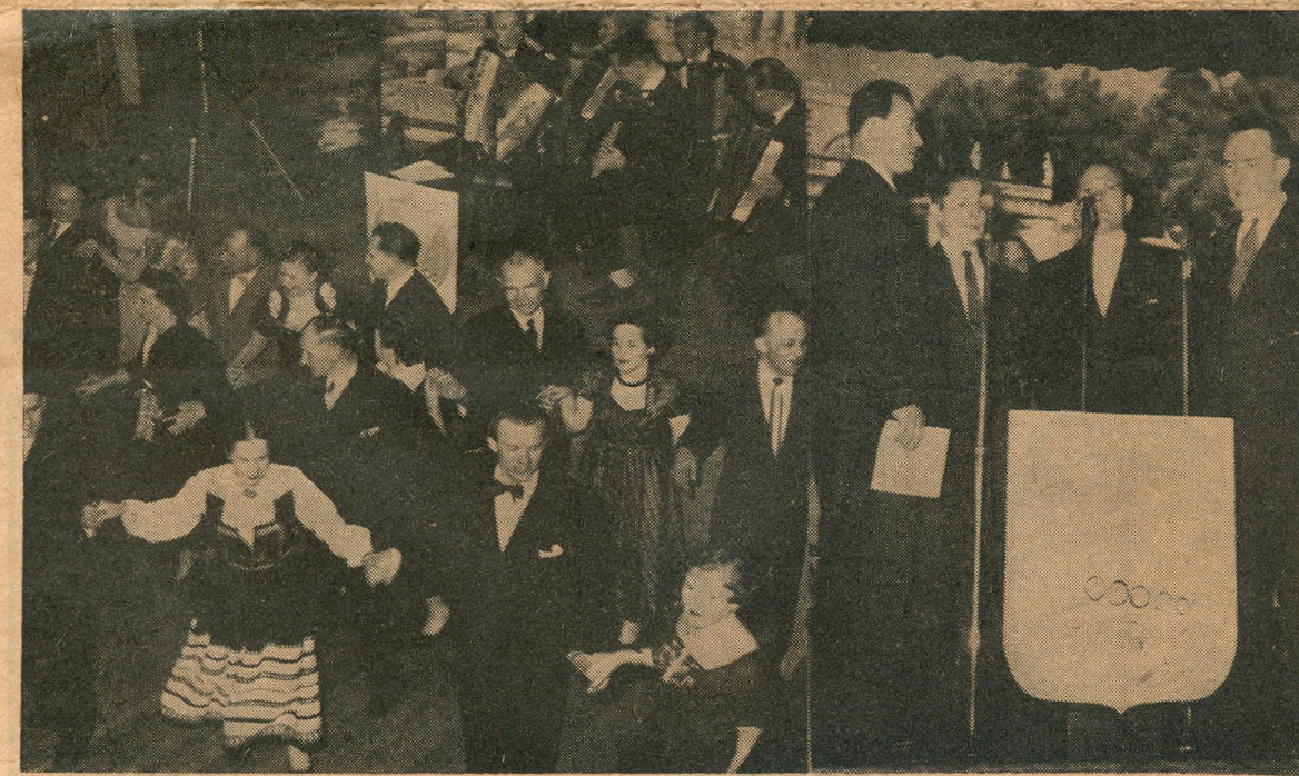
Vasakul: Perekonnavalss on täies hoos. Paremalt: Saarlaste meeskvartett